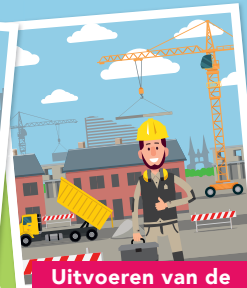
Uitvoeren van de werkzaamheden

We weten nu precies welke werkzaamheden we waar gaan uitvoeren. Dat kan sloop/ nieuwbouw zijn, woningverbetering of bijvoorbeeld een aansluiting op een aardgasvrij netwerk.